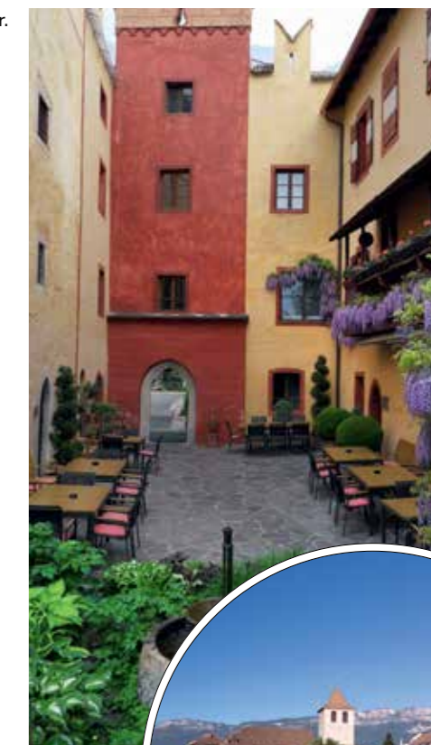
Die Kellerei Muri-Gries verfügt über 35 Hektar Weinberge in und um Bozen.