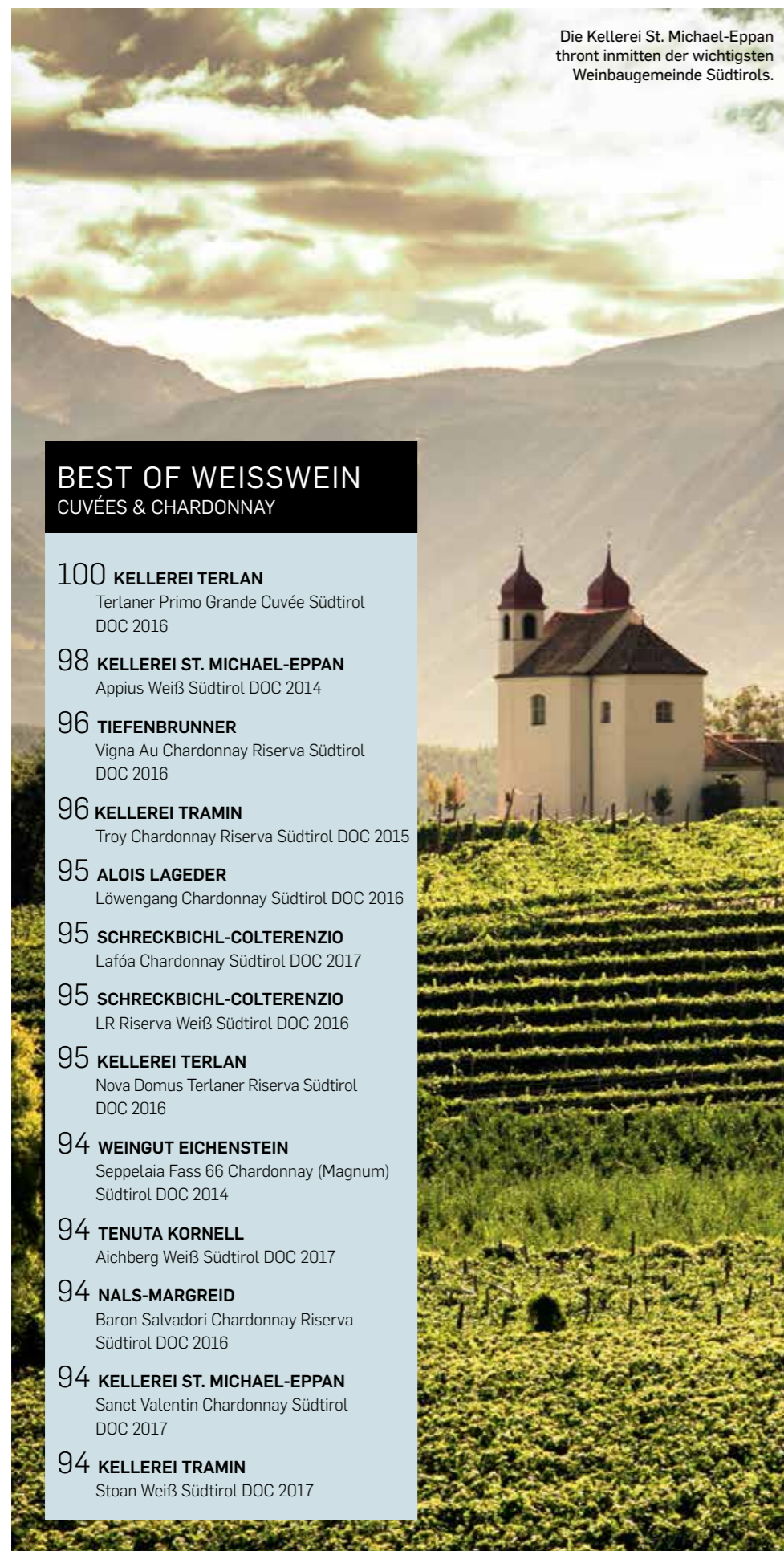
Die Kellerei St. Michael-Eppan thront inmitten der wichtigsten Weinbaugemeinde Südtirols.