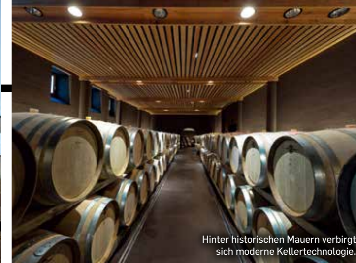
Hinter historischen Mauern verbirgt sich moderne Kellertechnologie.

1 00 Punkte, zum ersten Mal in Südtirol, zum ersten Mal für einen Weißwein aus Italien: der Terlaner Primo 2016, ein großer Wein aus einem großen Jahrgang. Der Primo ist aber kein Einzelfall. Es gibt noch viele andere Spitzenweine aus dem traditionellen Weinbaugebiet am Südhang der Alpen. Hier trifft sich das kühle und raue alpine Klima mit dem milden und warmen mediterranen Klima und schafft so ideale Vor-