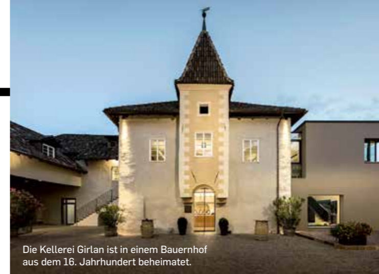
Die Kellerei Girtan ist in einem Bauernhof aus dem 16. Jahrhundert beheimatet.

Optimale Bedingungen: In der Südtiroler Gemeinde Eppan wird seit über 2000 Jahren Wein angebaut.