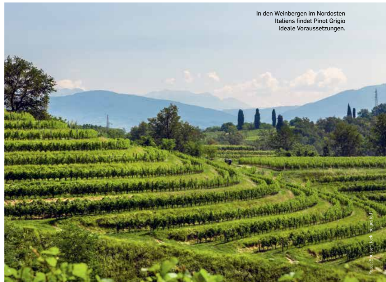
In den Weinbergen im Nordosten Italiens findet Pinot Grigio ideale Voraussetzungen.

● Turmhof Pinot Grigio Südtirol DOC 2017, Weingut Tiefenbrunner 13,5 Vol.-%, DIAM. Intensives, satt leuch-