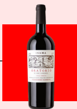
Oratorio di San Lorenzo Inama – 2017

Un sauvignon che si presenta leggermente ridotto rispetto ai classici monovarietali alto atesini, una stilistica scelta e ricercata proprio dalla cantina stessa. Pietra focaia, sambuco, pesca, leggere note di polvere da sparo, un naso molto invitante con dei profumi che ricordano i grandi sauvignon dei cugini d'Oltralpe. Al palato minerale con un incredibile nota sapida, lungo sul finale e tagliente al punto da richiedere un piatto importante come questo, che ne fa un abbinamento ideale.